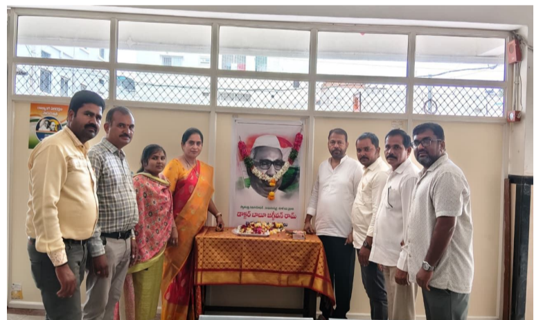
ట్రైబల్ వర్కింగ్ జర్నలిస్ట్ సమస్యలను అధిష్టానశీ దృష్టికి తీసుకెళ్లండి డిసిసి దంపతులతో టీ డబ్ల్యూ జే యు నేతల వివరాలు.