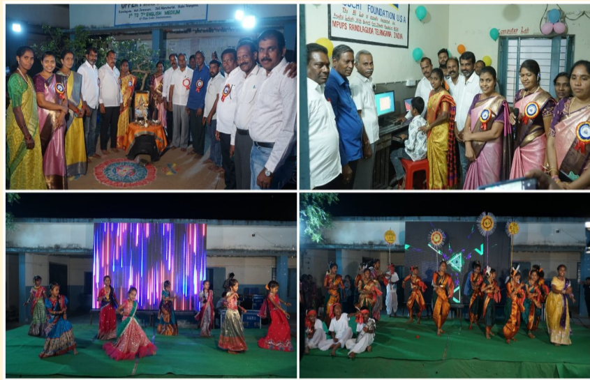
మన దునియా (ప్రతినిధి శరత్) మార్చి 08:జనారం